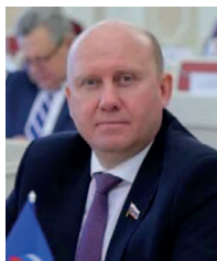
Космачев Вячеслав Владимирович , заместитель Председателя Правительства Пензенской области – Министр здравоохранения Пензенской области